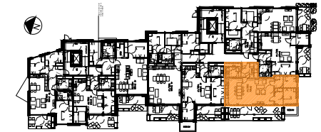
PLAN 3 ETASJE