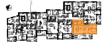
PLAN 4 ETASJE