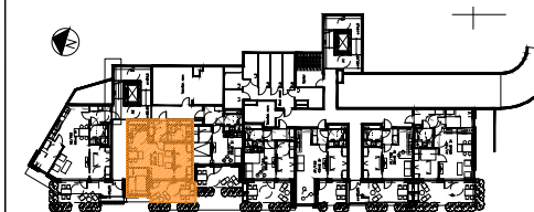
PLAN 1 ETASJE