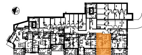
PLAN 2 ETASJE